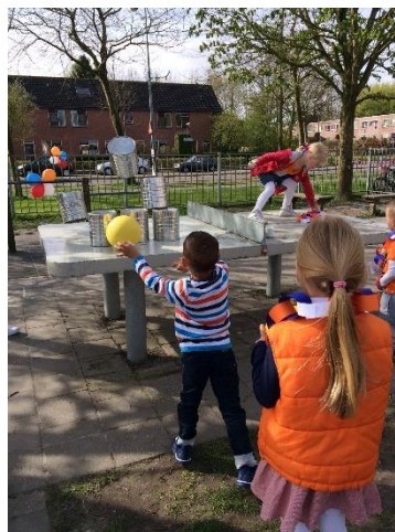
Koningsspelen voor de kleuters