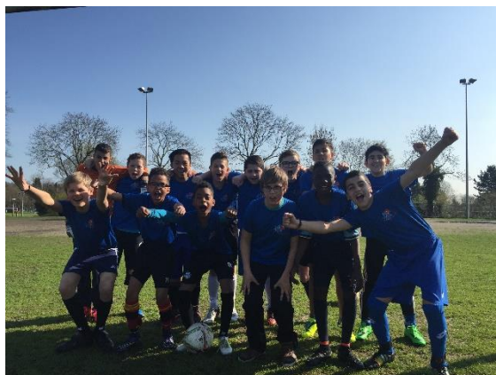
Schoolvoetbal van de groepen 7 en 8

Tijdens het schoolvoetbal gingen de meiden van groep 8 door naar de 2e ronde en hebben de jongens van groep 7 en 8 een bronzen plek verdiend!